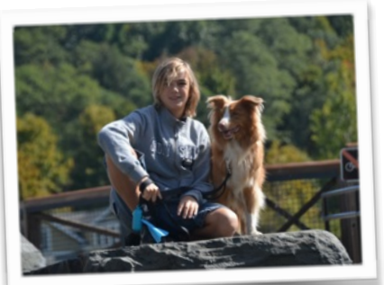
Loup & Abyss