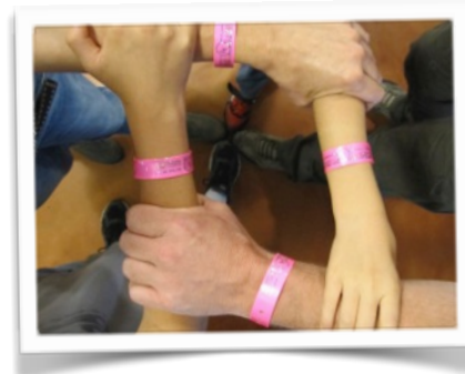
Nos supers bracelets