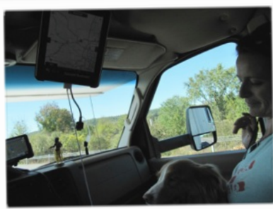
Abyss voulait être devant