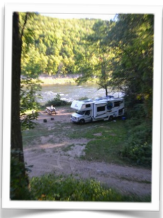
Campement de la nuit du 23 au 24. Demain ça fera une semaine qu'on est parti