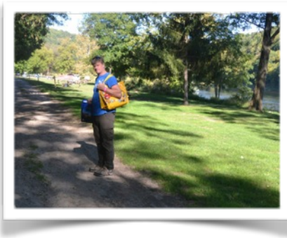
Départ vers la Laundry...