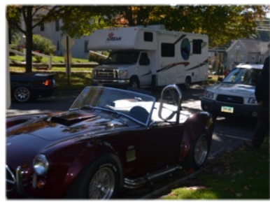
Mais qu'est-ce là, garée près de Polo ?!