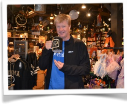
Un petit café ?!