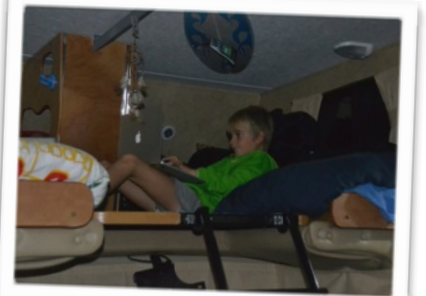
Mine craft !