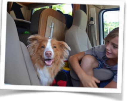
Abyss et Loup