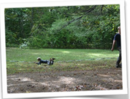
Il semble que la slack line ne soit pas assez tendue