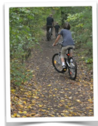
Journée pluvieuse mais chaude