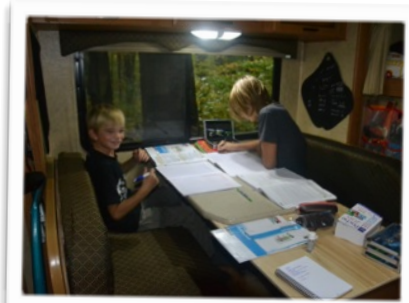
Journée studieuse... On a du rattrapage à faire