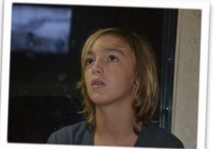
Et enfin l'air absorbé d'un enfant qui jouent à la PS3 ;)