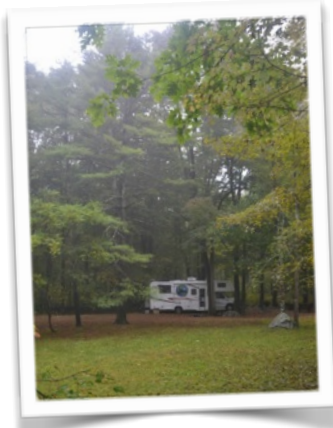
Notre campement nuits du 20 et 21 septembre.