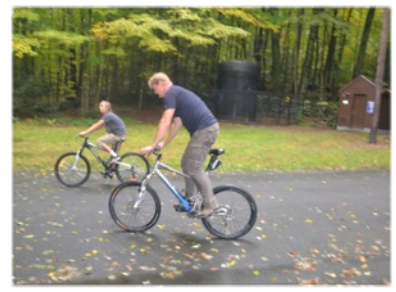
Une petit balade pour couper la journée